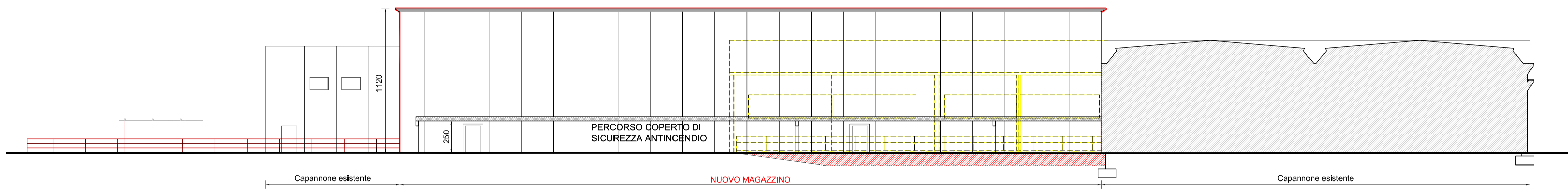
PROSPETTO NORD-EST - INTERVENTI