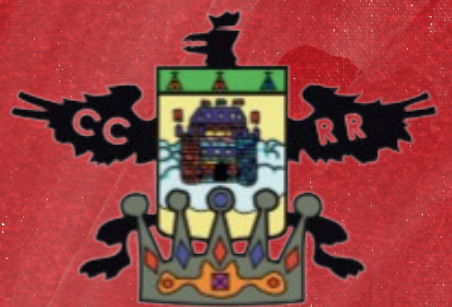
CCRR “Laura Prati”