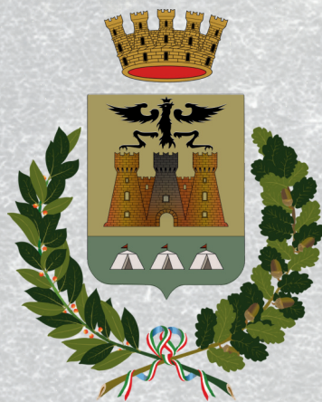
Città di Cardano al Campo